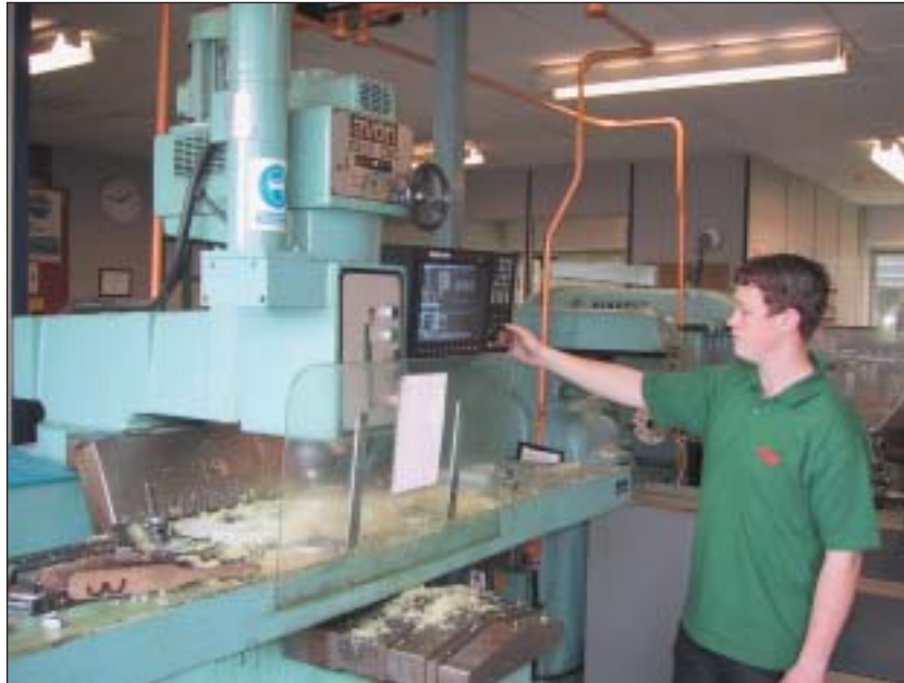
Dysgwyr yn rhaglennu peiriant CNC mewn canolfan hyfforddiant cwmni.

Mae rhai cwmnïau mawr sy'n seiliedig ar beirianeg wedi cadw eu canolfannau hyfforddi. Fodd bynnag, y duedd bellach yw gwneud mwy o ddefnydd o gyfleusterau hyfforddiant coleg ar gyfer hyfforddi prentisiaid, a pheidio â chynnal hyfforddiant ar y safle. I ryw raddau, gwelwyd hyn fel dull mwy cost effeithiol, sef bod cwmni'n is-gontractio hyfforddiant i ddarparwr neu goleg.