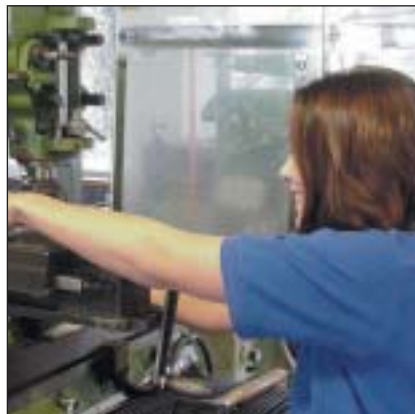
Prentis modern yn gosod peiriant melino fel rhan o'i rhaglen hyfforddiant.

Bydd mwyafrif y dysgwyr yn datblygu'u medrau galwedigaethol yn y gweithle, gyda threfniadau rhyddhau undydd i ffwrdd o'r gweithle. Yn ôl y patrwm arferol, bydd Prentisiaid Modern yn y coleg yn llawn amser am y flwyddyn gyntaf, gyda chyfnodau byr o brofiad gwaith o bosibl. Yn ystod y flwyddyn gyntaf hon byddant yn cwblhau CGC lefel 2 ynghyd â rhan gyntaf y cymhwyster Tystysgrif Genedlaethol neu City and Guilds ar gyfer gwybodaeth ategol. Dilynir hyn wedyn gan drefniant rhyddhau undydd o'u cyflogwr am weddill eu rhaglen hyfforddiant. Ar ôl cwblhau'u Prentisiaeth Fodern, bydd dysgwyr wedi cyflawni CGC lefel 3, y Dystysgrif Genedlaethol neu gyfwerth a thri neu fwy o fedrau allweddol.