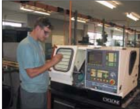
Prentis yn gwneud gwaith ar beiriant CNC.